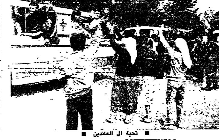
تحية الى المعتقلين